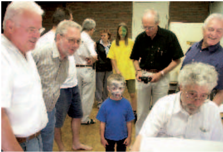
Foto: »Bei uns wird nicht mehr geknipst, nicht mehr fotografiert, nur noch digitalisiert.«