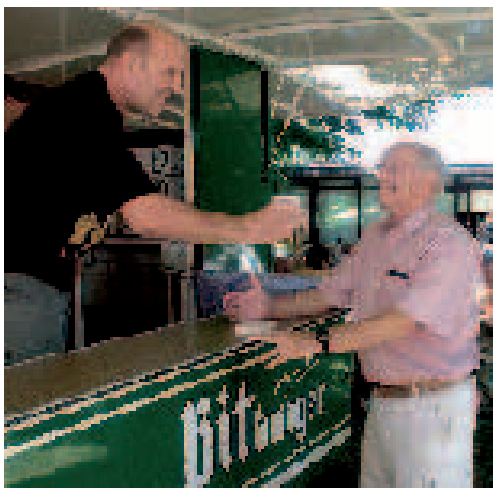
Am Bierstand: Der Mundschenk: »... hier trinken oder als Geschenk einpacken?«

Ein ganz herzliches Dankeschön den unzähligen Helferinnen und Helfern, die zum Gelingen der Klubhocketse beitrugen. Denn es war wie immer: »Von alloi goht halt nix!«