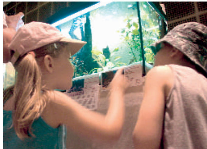
Aquaristik/Terraristik: Beim Betrachten des großen Tausendfüßlers: »Mama, guck doch mal, die Schlange hat Füße!«