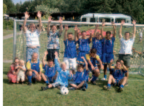
Das Siegerequipe Moog Böblingen

Die Pokale überreichte der Präsident des BSV, Siegfried Schlegel, der mit dem Verlauf des Turniers sehr zufrieden war. Es war eine Werbung für den Betriebssport Fußball. UWE SCHMIDT