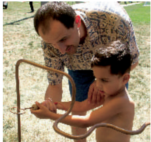
Der »Heiße Draht« – organisiert von der Sparte Tanz Ein Vater: »Jetzt langsam, voorsichtig, langsamer, pass doch auf, nun nach oben...« Der kleine Sohn: »Mensch, dann mach es doch selbst!«

Ein ganz herzliches Dankeschön den unzähligen Helferinnen und Helfern, die zum Gelingen der Klubhocketse beitrugen. Denn es war wie immer: »Von alloi goht halt nix!«