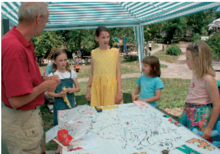
Das Chaos-Spiel organisiert von der Sparte Sport und Spiel 1 Der Betreuer: »Puh, alles ein Chaos, ich weiß nicht mehr, wer was macht! Chaos!«